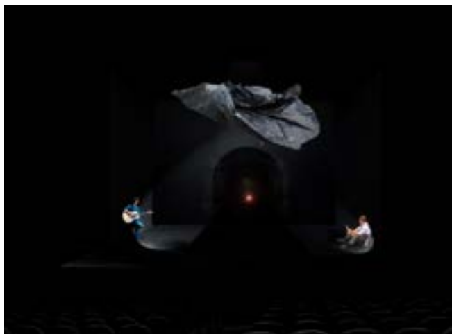
La masa negra.