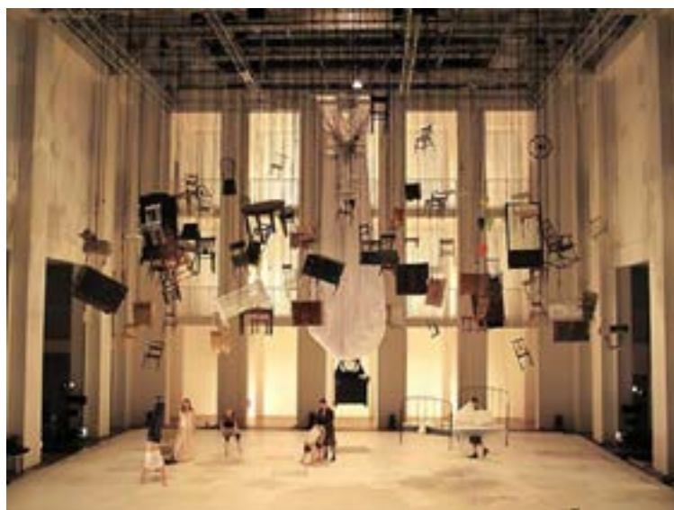
Referencias para puesta en escena Instalación de la artista japonesa Chiharu Shiota

Compagina todas estas actividades participando en talleres de teatro con asociaciones solidarias y de voluntariado.