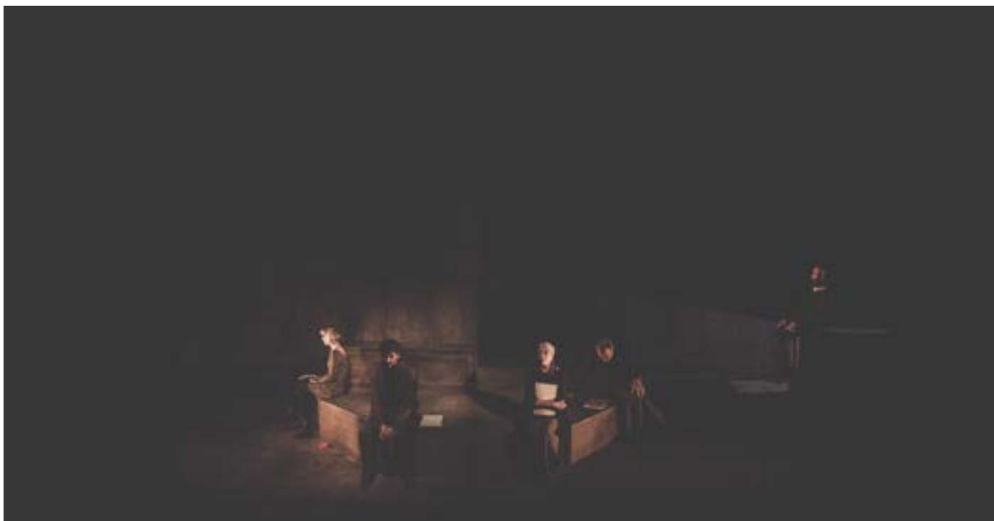
Fotografía realizada durante la lectura dramatizada de la obra en el Centro Dramático Nacional.

Los personajes, inmóviles, como estatuas, cada uno en un pilar, bajo una luz blanca. Parecen estatuas de mármol. O las estatuas de cadáveres de Pompeya. O las momias de Guanajuato. No se mueven. Es como si el tiempo no hubiera pasado por ellos.