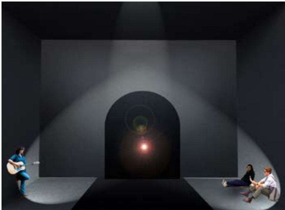
El metro - Escena I

Buscamos una estética minimalista, sugerente, directa y con elementos surrealistas . A continuación algunos ejemplos: