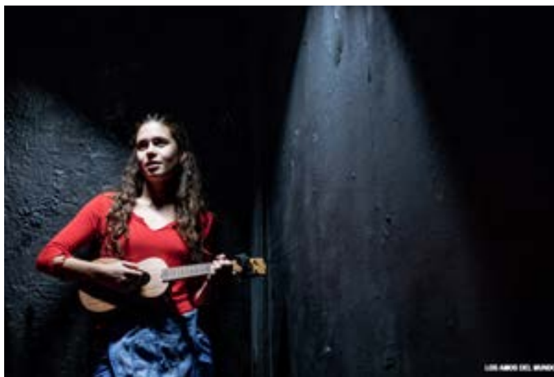
La primera escena de Los amos del mundo en Microteatro Por Dinero Madrid